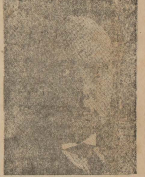
İtalyan Başvekil M. Musolini

İngiltere ile İtalya iştirak etmeyecekmiş